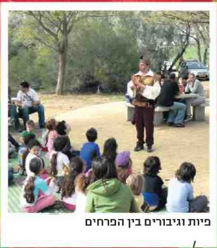
פיות וגיבורים בין הפרחים