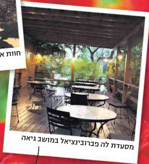
מסעדת לה פברוניציאל במושב גיאה